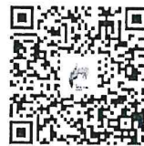
สิ่งที่ส่งมาด้วย ๒ ช่องทางเข้าร่วมอบรมฯ